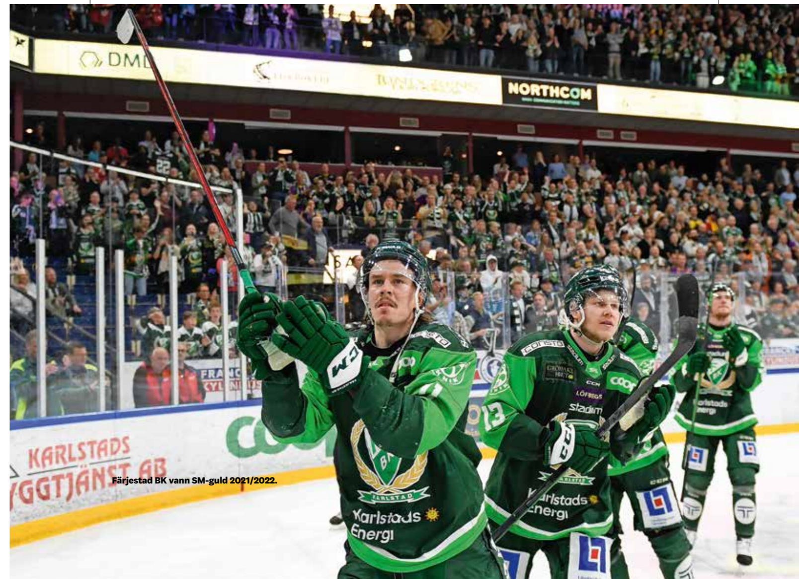
Färjestad BK vann SM-guld 2021/2022.