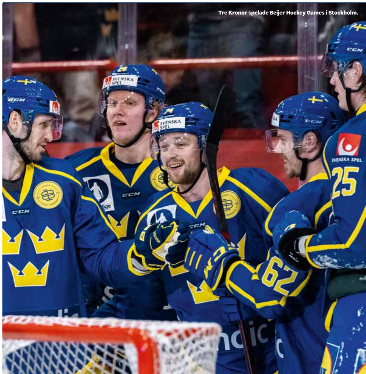
Tre Kronor spelade Beijer Hockey Games i Stockholm.