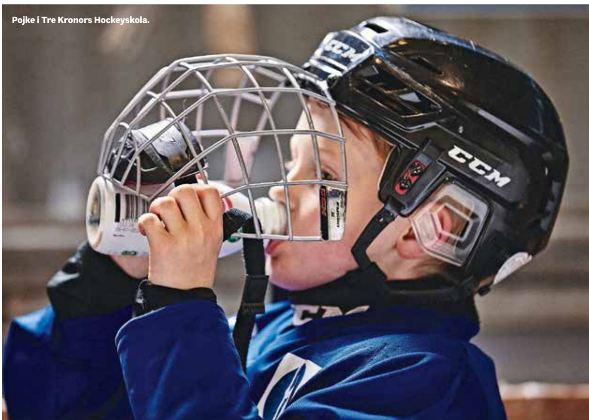
Pojke i Tre Kronors Hockeyskola.