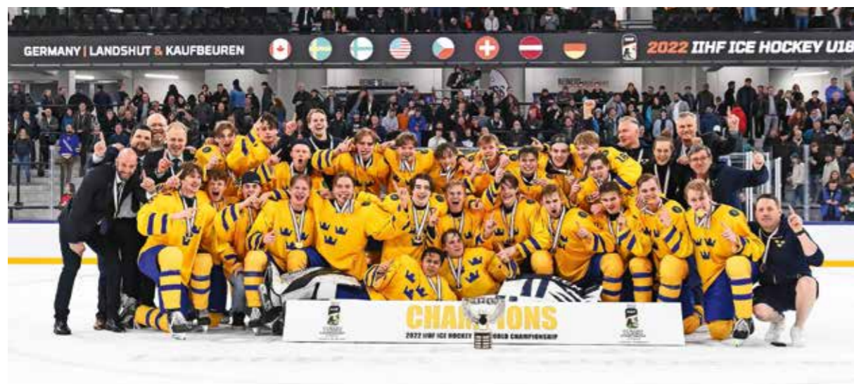
U18-landslaget vann guld i U18-VM.