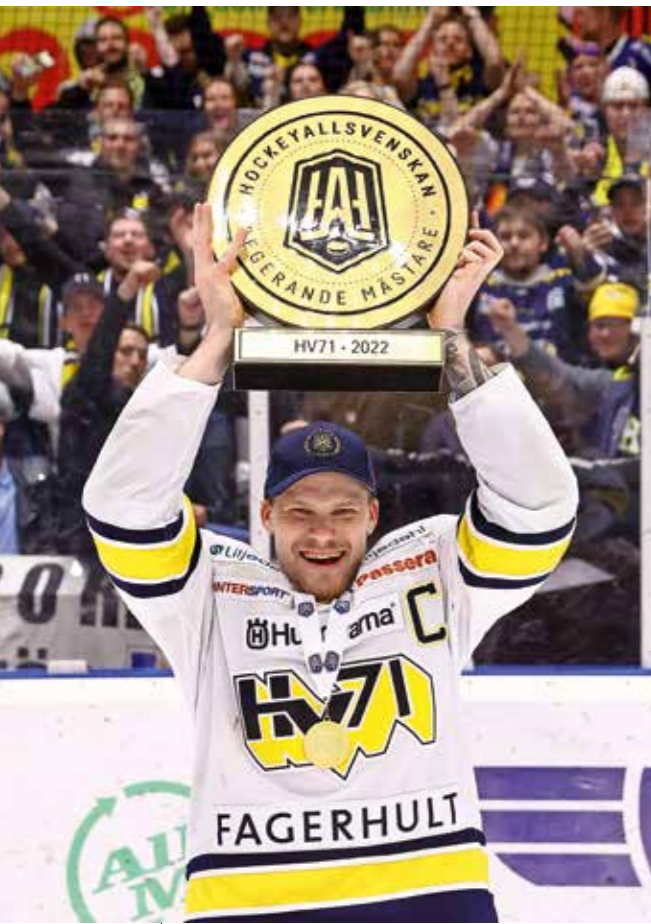
HV71 spelade sig tillbaka till SHL.