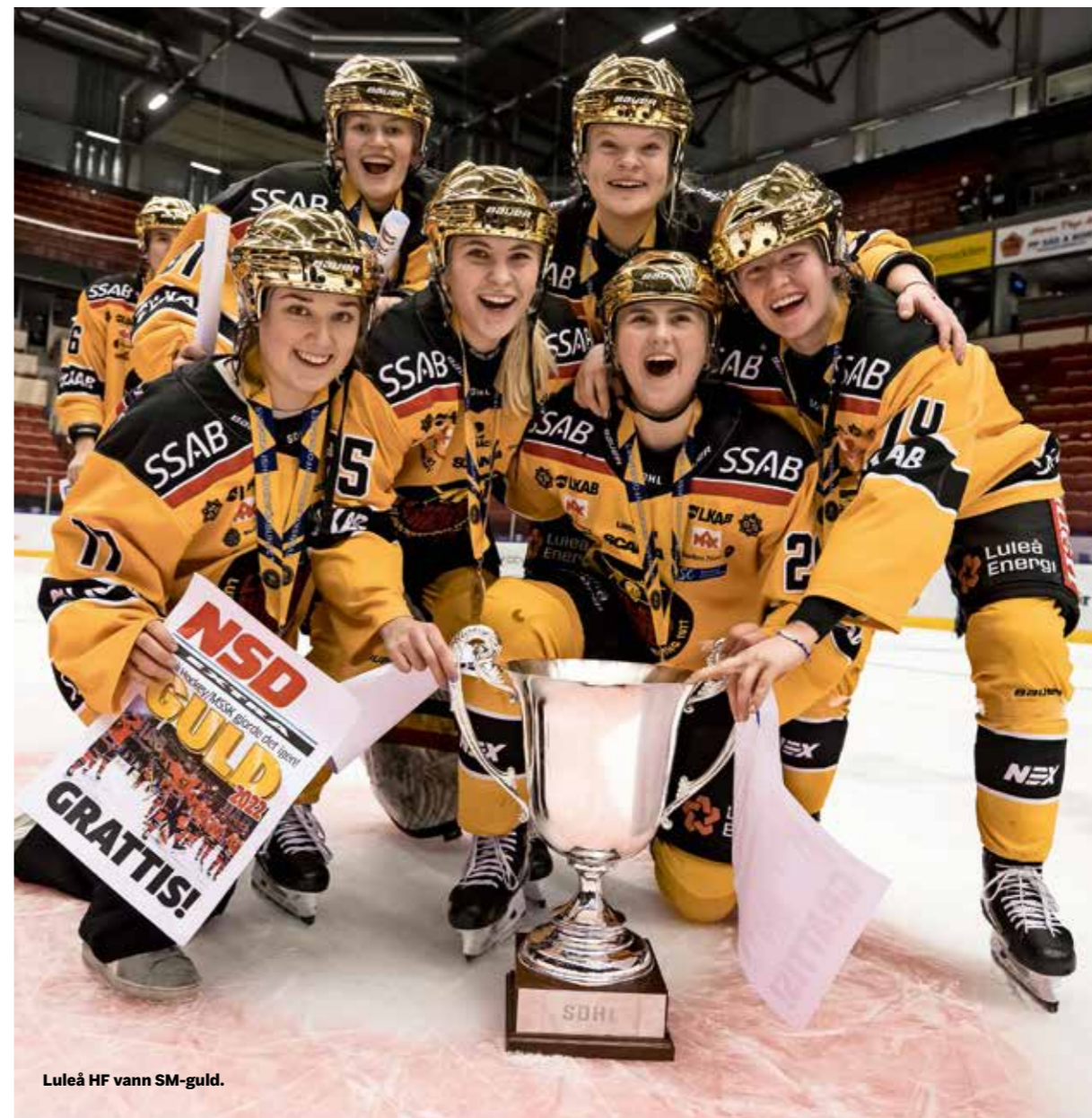
Luleå HF vann SM-guld.