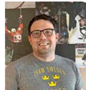
Lars Blomqvist Sports Marketing Europé

Under hösten fick vi fin hjälp av Tre Kronor i Mustaschkampen, den viktiga kampanjen mot Prostatacancer som vi varje år genomför i alla våra 113 byggvaruhus runt om i landet. Stort tack för er hjälp! I maj bjöd vi in till Beijer Hockey Games och äntligen fick Tre Kronor spela inför publik igen! Turneringen gav oss också möjlighet att bjuda in 2 000 Beijerkunder till en leverantörmässa med pregames och actionfyllda aktiveringar i mässonrådet. Ett mycket uppskattat event hos våra byggkunder. I år låg Beijer Hockey Games precis innan VM och blev ett fint genrep – vi är stolta över att kunna få bidra till en så fin turnering!