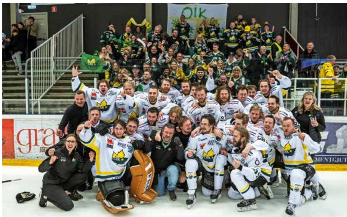
Östersunds IK spelade sig upp till HockeyAllsvenskan.