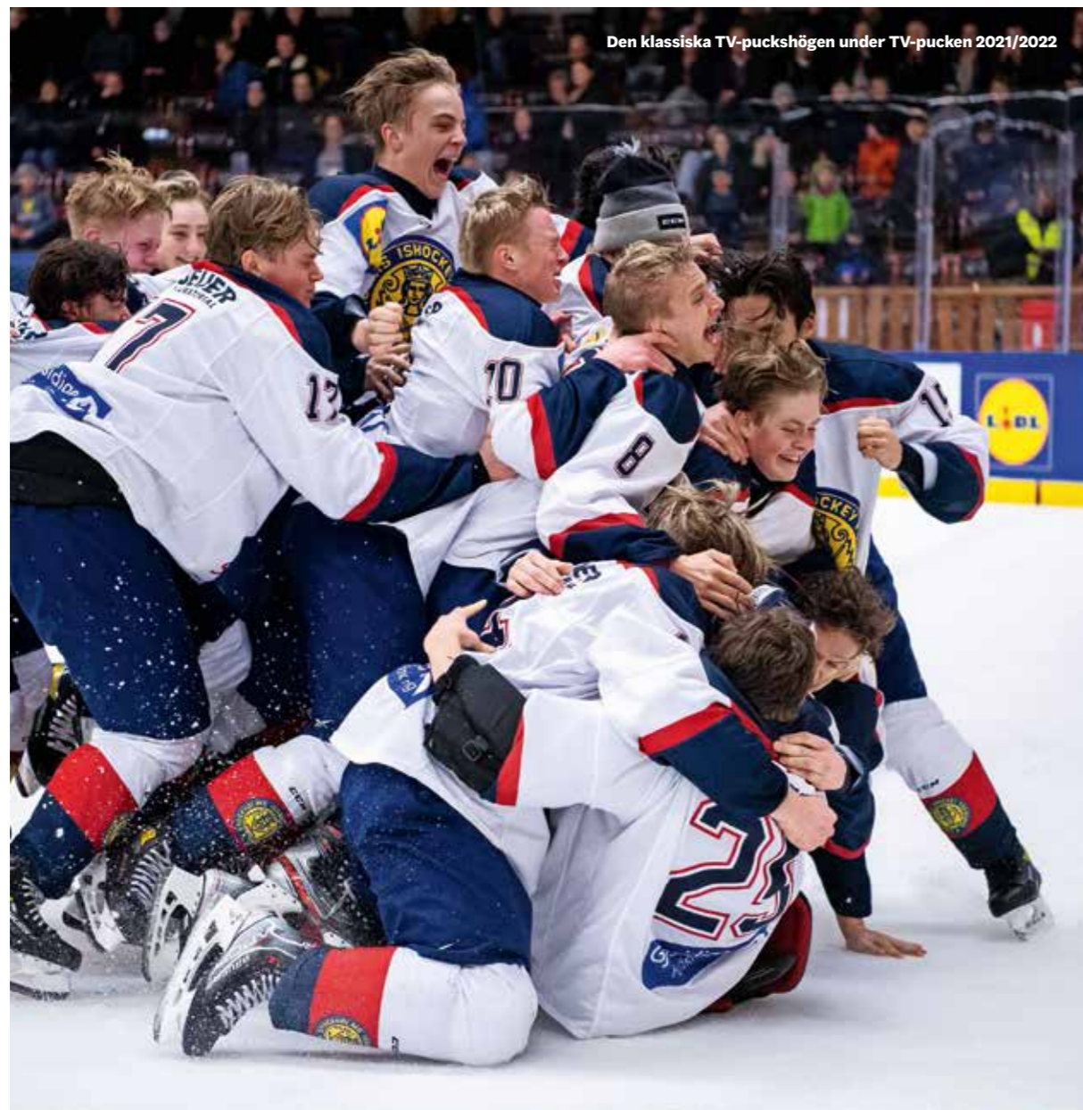
Den klassiska TV-puckshögen under TV-pucken 2021/2022