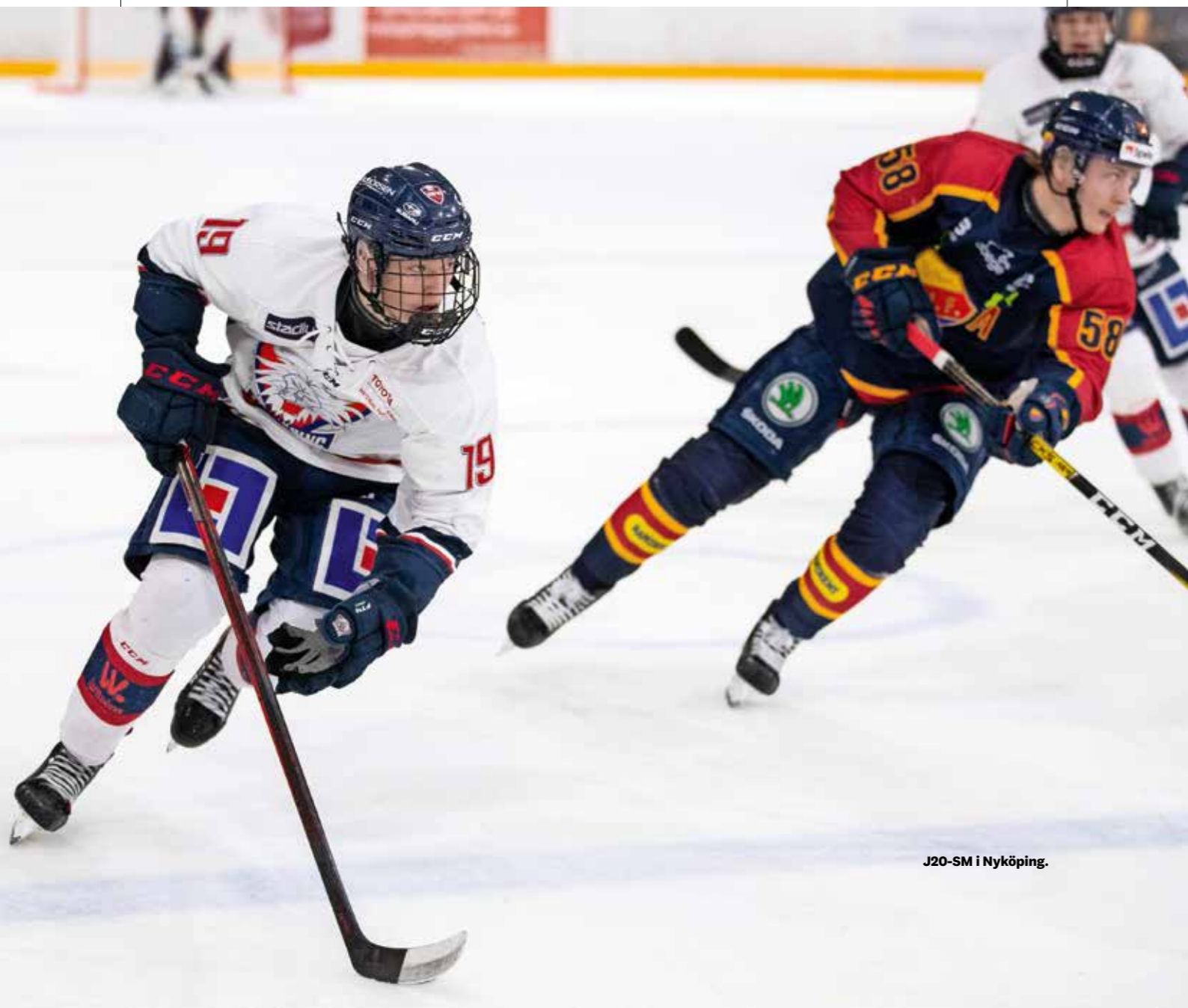
J20-SM i Nyköping.