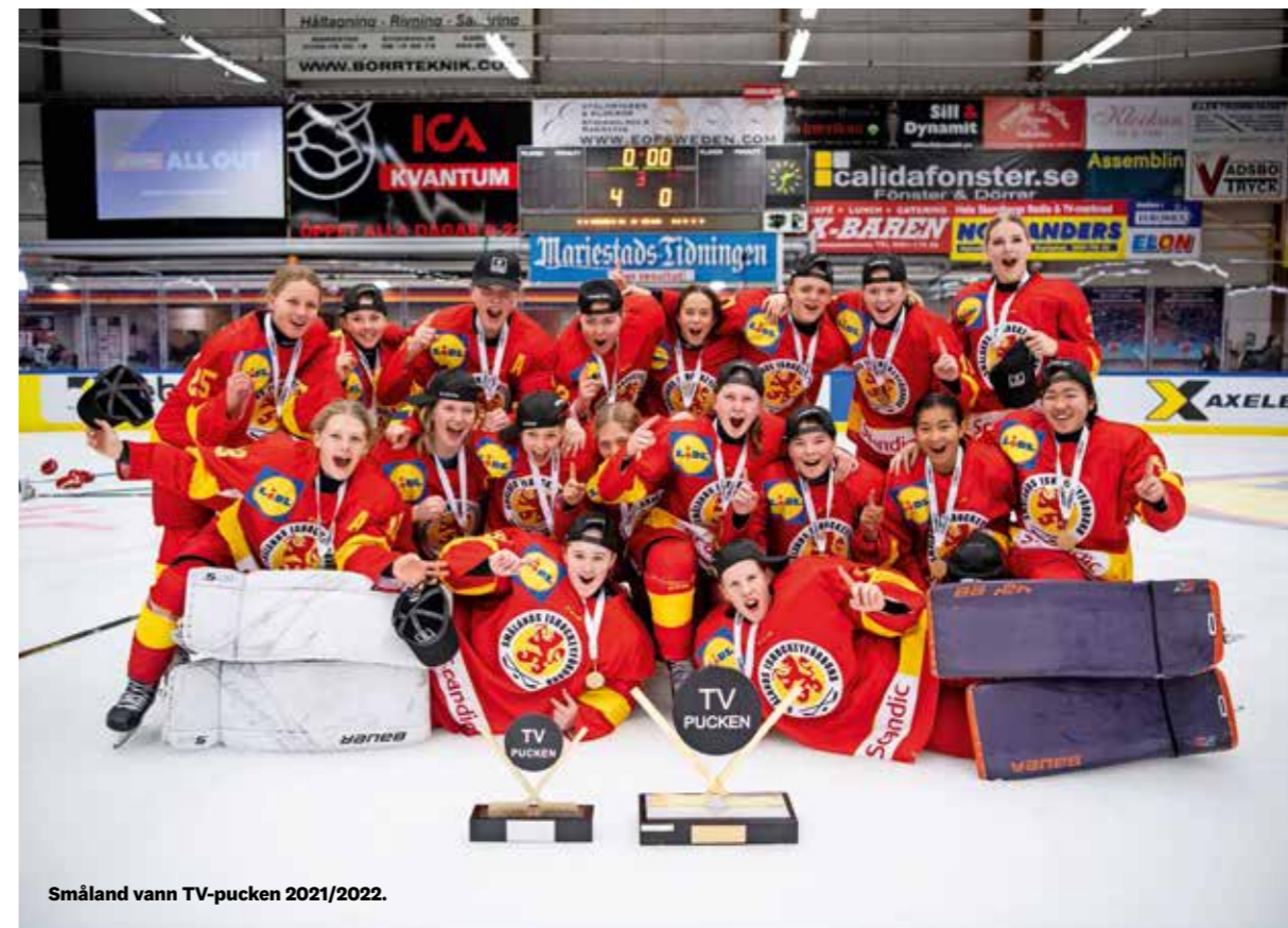
Småland vann TV-pucken 2021/2022.