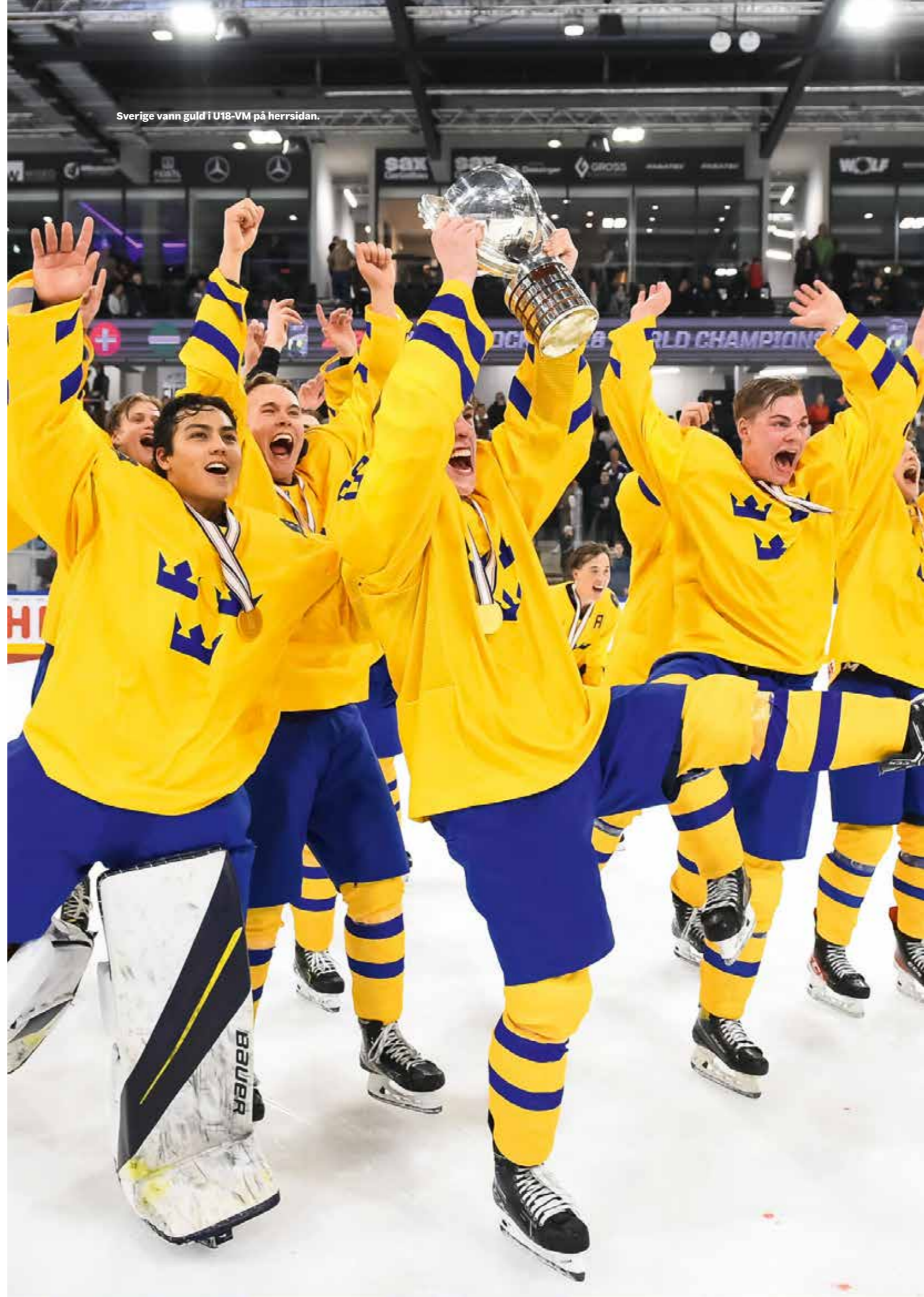
Sverige vann guld i U18-VM på herrsidan.