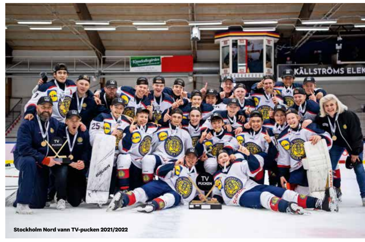
Stockholm Nord vann TV-pucken 2021/2022