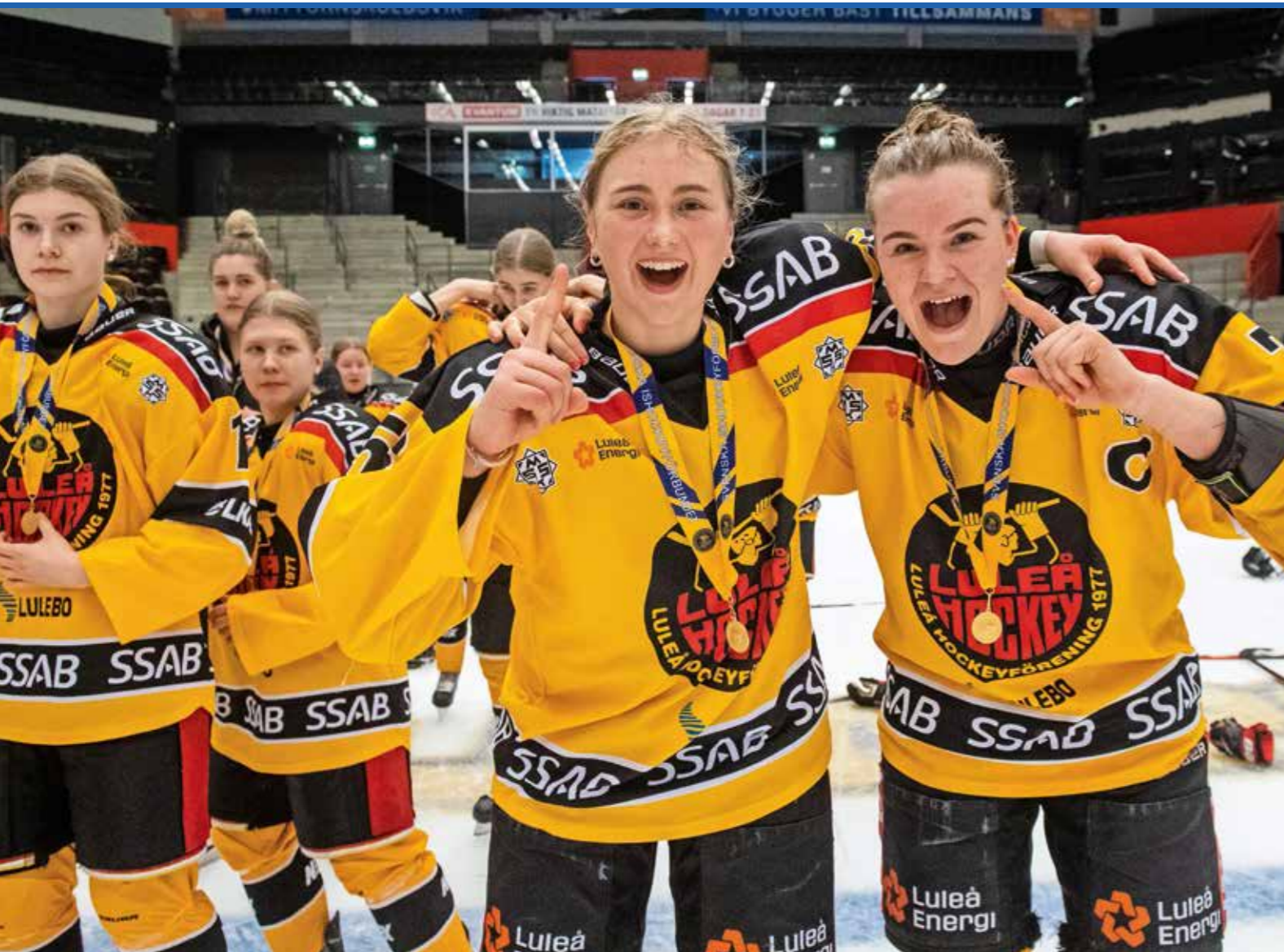
Luleå HF vann Juniorcupen 2022.